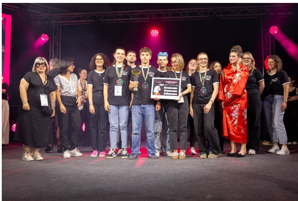
Remise des prix – Hair Montpellier 2025