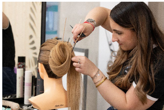
Concours – Hair Montpelliers 2025