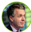
Christophe BECHU, Maire, VILLE D'ANGERS , & Président, ANGERS LOIRE MÉTROPOLÉ