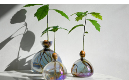
Avocado Vase et Acorn Vase - ILEX STUDIO