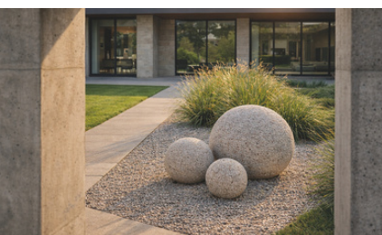
Art Déco - GRANULATI ZANDOBBIO