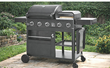
Barbecue Gaz 3 en 1 - FLAMY - COOK IN GARDEN