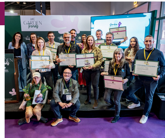
Les lauréats des Garden Collections Awards 2026-2027