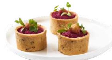
LES TARTELETTES SALÉES