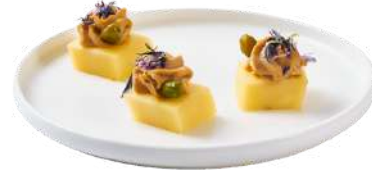
LES DÉS DE COMTÉ