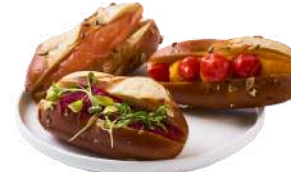
LES MINI PAINS BRETZEL

Viande de Bœuf grillée, crudités & sauce béarnaise • Saumon fumé, crudités & fromage frais aneth • Houmous, Falafel, sauce piquante & herbes fraîches