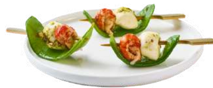
LES BOUCHÉES FRAÎCHEUR