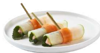
MINI ROULEAUX DE PRINTEMPS REVISITÉS

Crevette entière, feuille de Pomme, zeste de Citron & ruban de Carotte ou Aubergine grillée, feuille de Pomme, zeste de Citron & ruban de Carotte