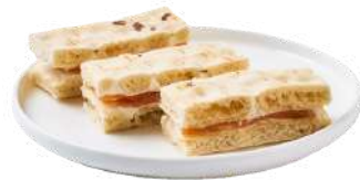
LES MINI SANDWICHS FINGER NORDIQUE

Pain polaire, Saumon ou Truite fumé & fromage frais aux herbes