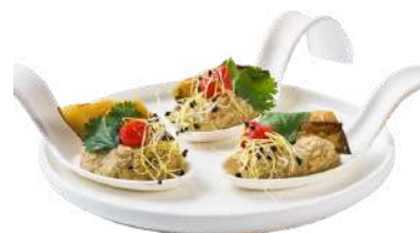
LES CUILLÈRES FANTASIES

Terre : Filet de Poulet, chutney, pistaches concassées & pointe de balsamique