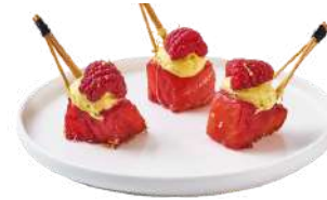
SAUMON GRIOTTE FRAMBOISE

Saumon infusé à la Griotte, crème de moutarde & Framboise fraîche