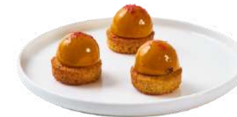
LES MINI SABLÉS

Sablés au curry, dôme de poivrons & pistache ou Sablés tomate, dôme de crevette & gingembre ou Sablé au parmesan, dôme de foie gras & fruits secs