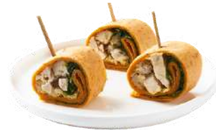
LES MINI WRAPS

Poulet Tandoori & Poivron • Petits Légumes & chèvre frais • Saumon fumé & fromage frais • Bœuf, crudités & sauce béarnaise