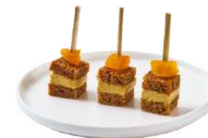
LES MILLEFEUILLES FOIE GRAS

Millefeuille de pain d'épices, Foie Gras & fruits confits