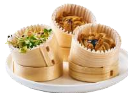
LES MINI VERRINES GOURMANDES

Julienne de Concombre, Radis & Carotte en étage marinés ou Panacotta de Poivron, tapenade de Champignons, copeaux de parmesan & persil ou Panacotta de Foie Gras & chutney de Mangue