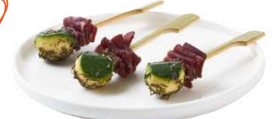
LES PICS BAMBOU