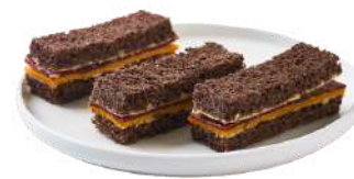
LES MINI SANDWICHS FINGER