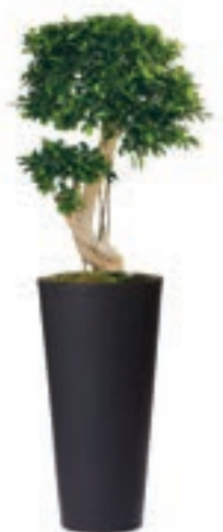
Réf. 113.410 A - Bonsaï ficus nitida en bac Partner noir ht totale 1,20 à 1,50 m

No floral selection or composition is beyond the capability or creativity of our master gardeners. We guarantee to find the right arrangements for you.