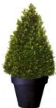
Réf. 111.140 - Buis cône Ø50 cm ht 1 à 1,20m Réf. 134.359 - Vase three noir