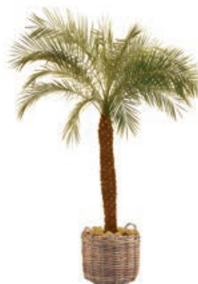
Réf. 113.230 - Phoenix roebelinii ht 1,80 à 2,10m Réf. 136.300 - Vannerie osier