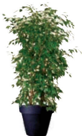
Réf. 113.160 - Ficus ht 1,80 à 2m Réf. 134.359 - Vase three noir