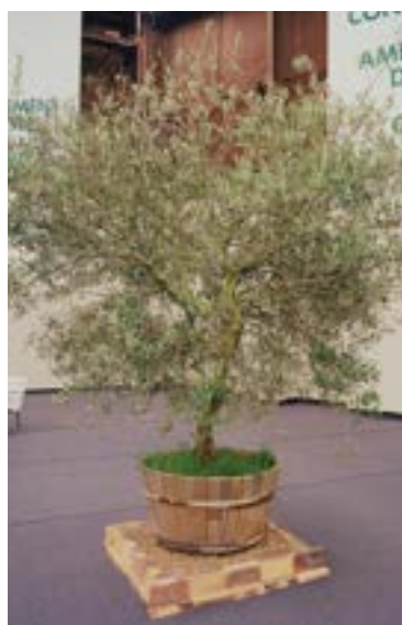
Réf. 122.160 - Olivier vieux tronc Ø 1,50 m ht 2,50 à 3 m