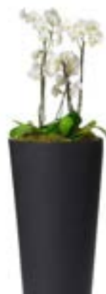
Réf. 113.410 C - Orchidées en bac Partner noir ht totale 1 à 1,10 m