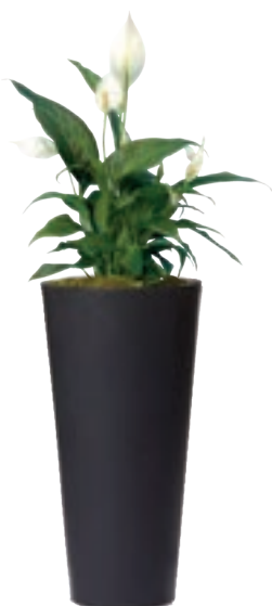
Réf. 113.300A - Spatiphyllum sensation en bac Partner noir ht 1,80 à 2 m