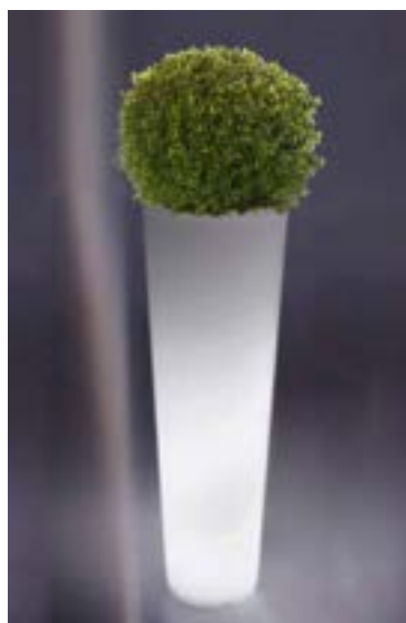
Réf. 134.326A - Bac PVC New Pot Maxi light Ø 44 cm ht 1,20 m avec buis boule Ø 45 cm