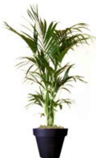
Réf. 113.200 - Kentia ht 1,80 à 2m Réf. 134.359 - Vase three noir