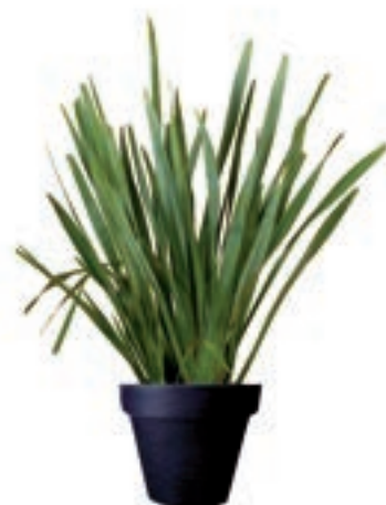
Réf. 112.300 - Phormium ht 1,20 à 1,50m Réf. 134.359 - Vase three noir