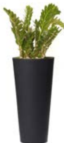
Réf. 113.410 B - Zamioculcas en bac Partner noir ht totale 1,30 à 1,50 m