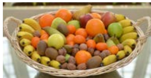
Réf. Pdfruit 10K