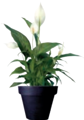
Réf. 113.310 - Spatiphyllum Sensation ht 1,20 à 1,50m Réf. 134.359 - Vase three noir