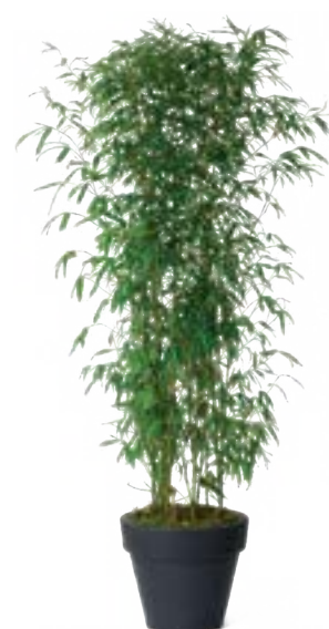
Réf. 111.110 - Bambou touffe ht 1,50 à 2 m Réf. 134.359 - Vase three noir