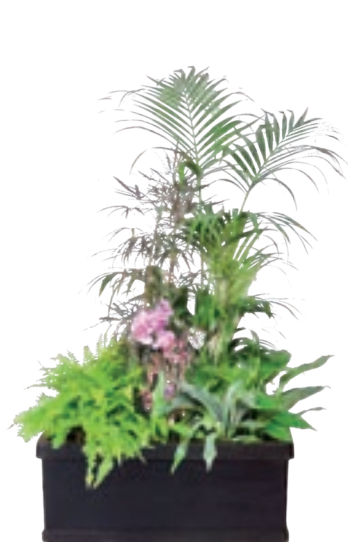
Réf. 143.200 - Bac rectangle noir 100 x 32 cm Composition de végétaux