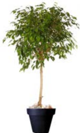
Réf. 123.220 - Ficus tige boule Ø1,20/1,50m ht 2,50 à 3m Réf. 134.359 - Vase three noir