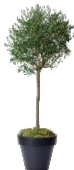
Réf. 112.020 - Olivier Réf. 134.359 - Vase three noir