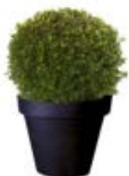
Réf. 111.125 - Buis boule Ø35/40 cm ht 0,50m Réf. 134.359 - Vase three noir