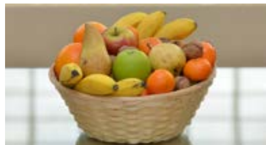
Réf. Pdfruit OSK