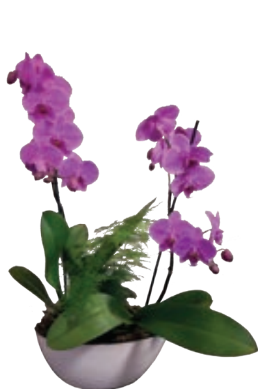
Réf. 182.200 - Coupe fleurie Ø 30 cm