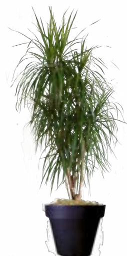
Réf. 113.130 - Dracaena maginata ht 1,80 à 2m Réf. 134.359 - Vase three noir