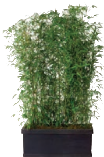
Réf. 142.960 - Bac rectangle noir 100 x 32 cm Haie de Bambous ht 2 à 2,50 m