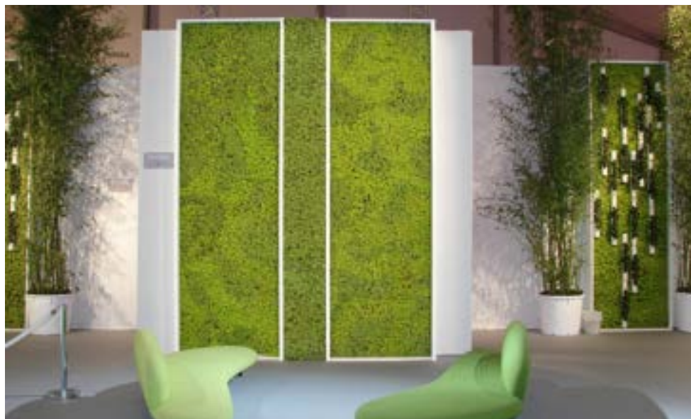
Tarifs sur devis