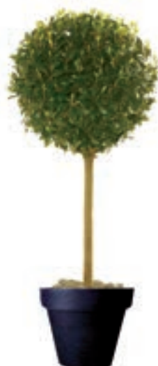
Réf. 112.160 - Laurier tige boule ht 1,80m Ø60cm Réf. 134.359 - Vase three noir