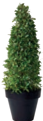
Réf. 112.135 - Laurier cône ht 1,50m Ø40/50cm Réf. 134.359 - Vase three noir

At Gally, we pride ourselves with the reputation of our presentations of both popular and exotic plant selections, presented in standard or tailor-made containers and designed to suit all tastes and decors. The objective is never to clash with or change the existing environment. Our specialists seek to create floral displays that blend with, and enhance, the beauty of the existing colour schemes and atmosphere.