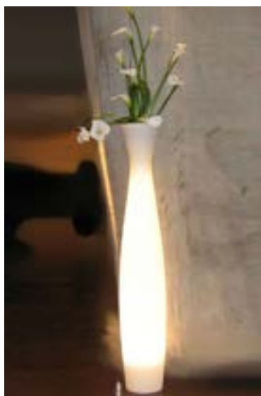
Réf. 134.259A - Bac Scarlett light Ø 28 cm ht 1,80 m avec Arums blancs et feuillages