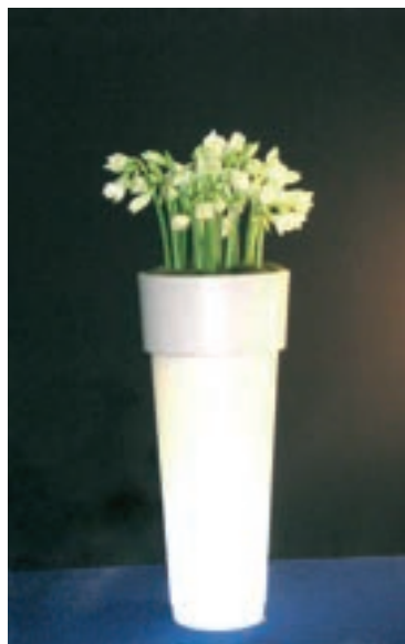
Réf. 134.320A - Bac Marcantonio light Ø 50 cm ht 1,20 m avec Amaryllis blancs

The Gally Design Centre is staffed by knowledgeable and innovative experts who are ready to respond to every customer request. Whether a standard selection or a bespoke solution, our master gardeners guarantee an unsurpassed level of professional advice, project execution and customer satisfaction.