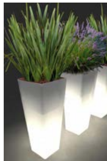
Réf. 134.327A - Bac PVC Kubis ASQ light 46 x 46 cm ht 1,10 m avec Phormiums