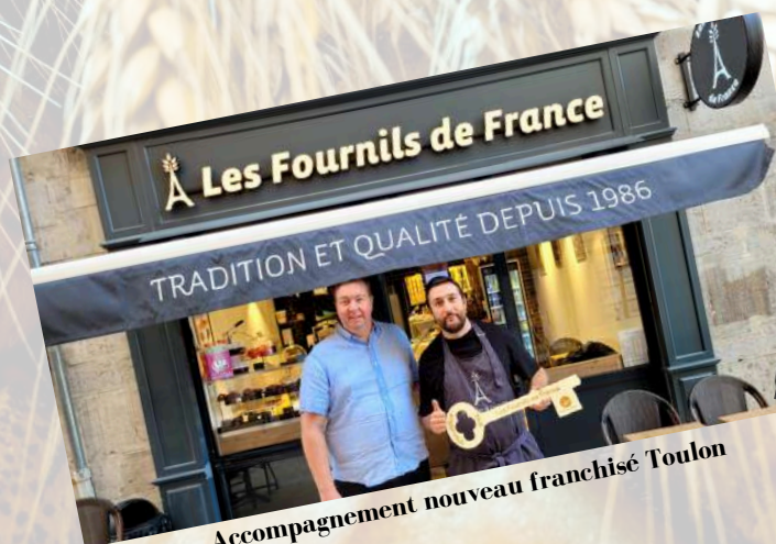
Accompagnement nouveau franchisé Toulon