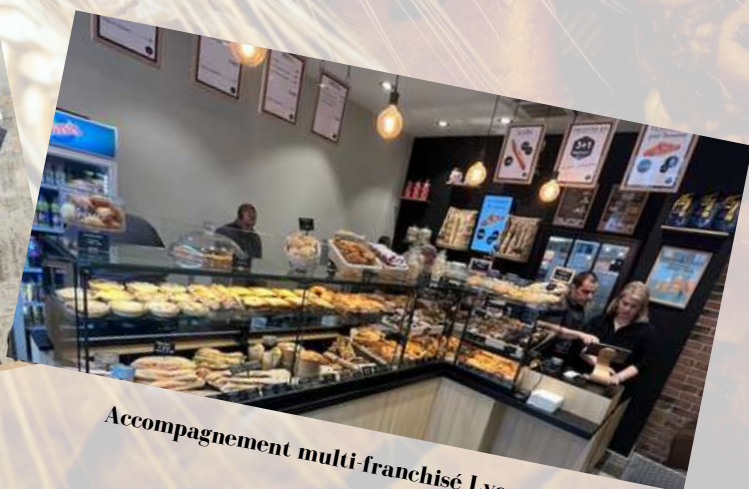
Accompagnement multi-franchisé Lyon