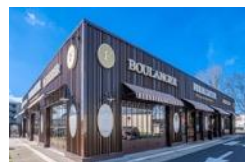
CA de 148M€ Ht 66 Unités