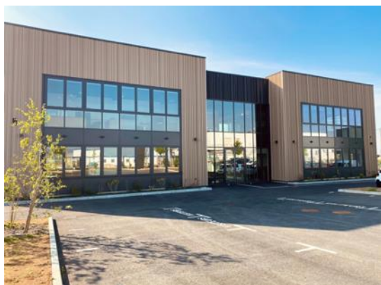
Siège social à Blois