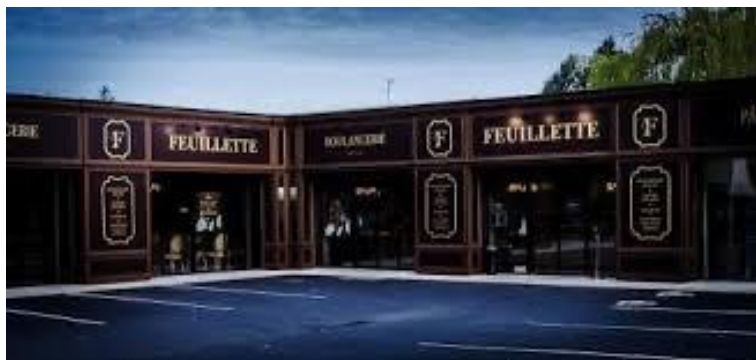
1 ère boulangerie sous enseigne