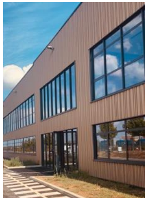
Laboratoire à Blois