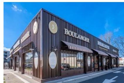
CA de 200M€ Ht 84 Unités