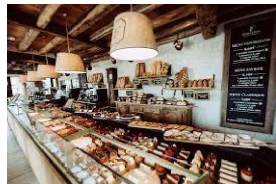
1 ère franchise à Poitiers