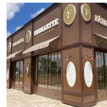
45 sites et un CA de 71M€ Ht