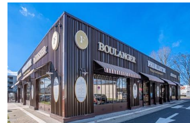
CA de 250M€ Ht 100 Unités (dont 76 franchises)