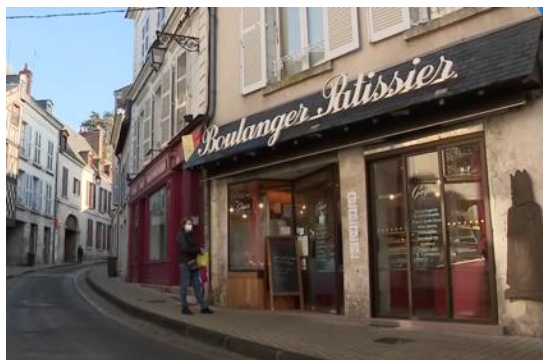
1 ère boulangerie indépendante à Blois