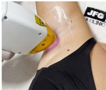
HTA Laser Triwave