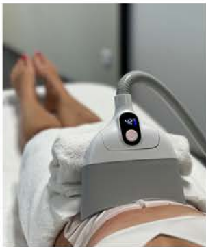
HTA TCryo 360°

HTA Technologies, c'est la marque technologique du groupe Novi. JFG Clinic bénéficie de son expertise pour avoir toujours en ses centres, les dernières innovations technologiques.