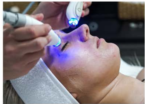
HTA Lift 4