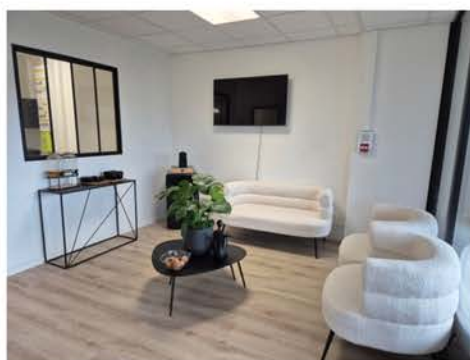
JFG Clinic Fargues-Saint-Hilaire (33)