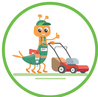
Bricolage - Jardinage