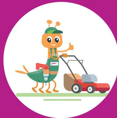
Bricolage - Jardinage