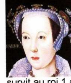
survit au roi 1 an