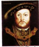
Henri VIII Tudor (1491-1547)