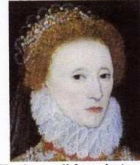
Reine d'Angleterre (1558-1603)