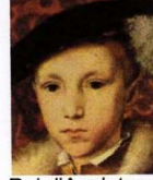
Roi d'Angleterre (1547-1553)