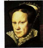
Reine d'Angleterre (1553-1558)