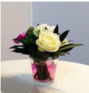
Rose Orchidée 15cm 36€ HT excl. TAX

For other bouquets: www.paysage.gally.com